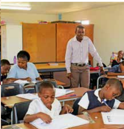
Hausaufgabenbetreuung für ältere Schülerinnen und Schüler ( Afterschool )