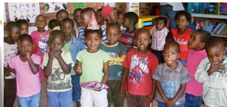
Geburtstagsfeier in der Vorschule