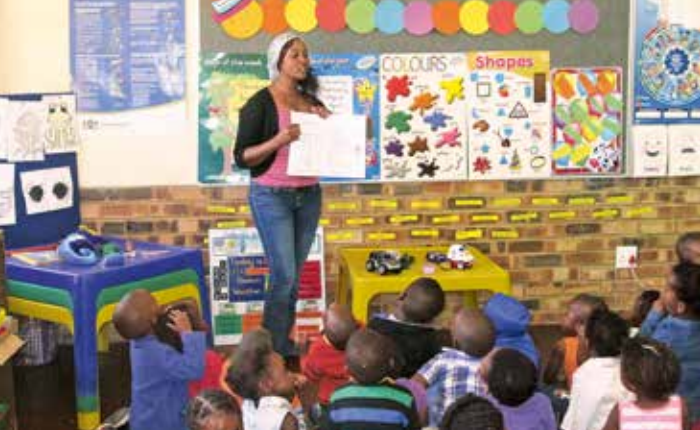
Unterricht in der Vorschule ( Preschool )